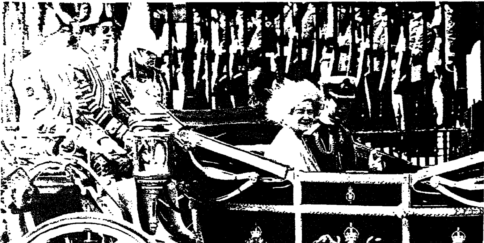
٨٠ "أجرة المفضلة" استثنائية ، لم تطر السماء في لندن عندما خرجت العائلة المالكة في بريطانيا في موكب غير عادي الى كاتدرائية سان بول حيث اقيم قداس احتفالي بدياسة لسلسلة احتفالات في مناسبة العيد الثمانين لجلاد الملكة الأم - زوجة الملك جورج السادس ، والدة الملكة اليزابيث بلغت الثمانين في الرابع من شهر آب الماضي . السوف اللندنيين وقفوا بحيون الموكب وهو يخرق وسط العاصمة حيث ترك رجال الاعمال والمصرفيون مكاتبهم وخرجوا لتحية «الجدة المفضلة» . في الصورة الملكة الأم وولسي العهد الامير تشارلز في عربة مكتشوفة (سنة ١٩٠٢) تجرها اربعة احصنة ..

كما سيجري مباريات فرق الدرجة الثالثة وعددها ١١٢ فريقا وبضمتها ١٧ فرقا من الوسط العربي .. بالإضافة الى مباريات من الدرجة الرابعة وبضمتها حوالي ٥٠ فرقا من الوسط العربي .